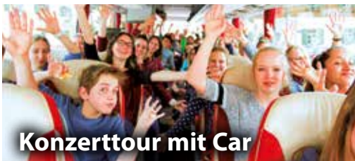
Konzerttour mit Car