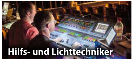
Hilfs- und Lichttechniker

«Das wohl beste Camperlebnis für meine Kinder!»